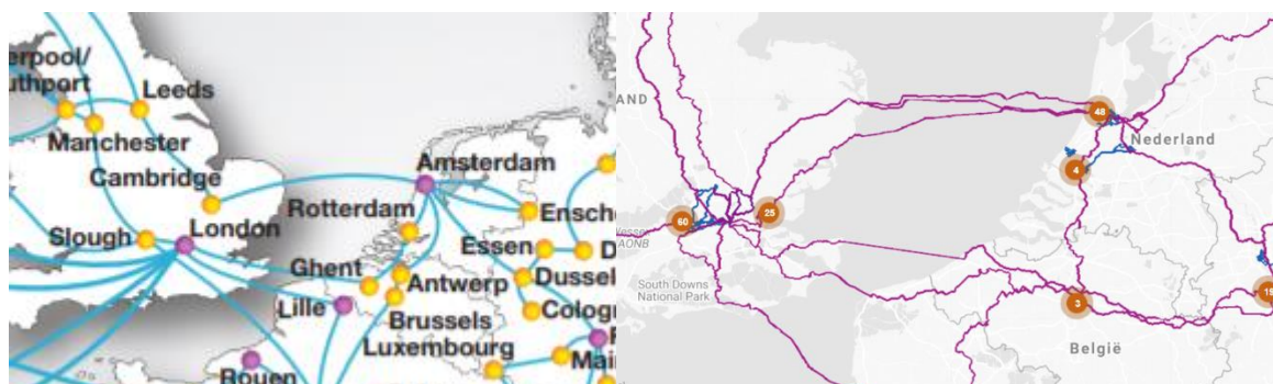
Figuur 3 Netwerk kaarten (gestileerd vs gedetailleerd)

Welke klanten precies gebruik maken van de kabels is vaak bedrijfsgeheim. Mede door faillissementen, overnames en veranderingen van bedrijfsnaam is het onduidelijk wie de actuele gebruikers van een kabel zijn.