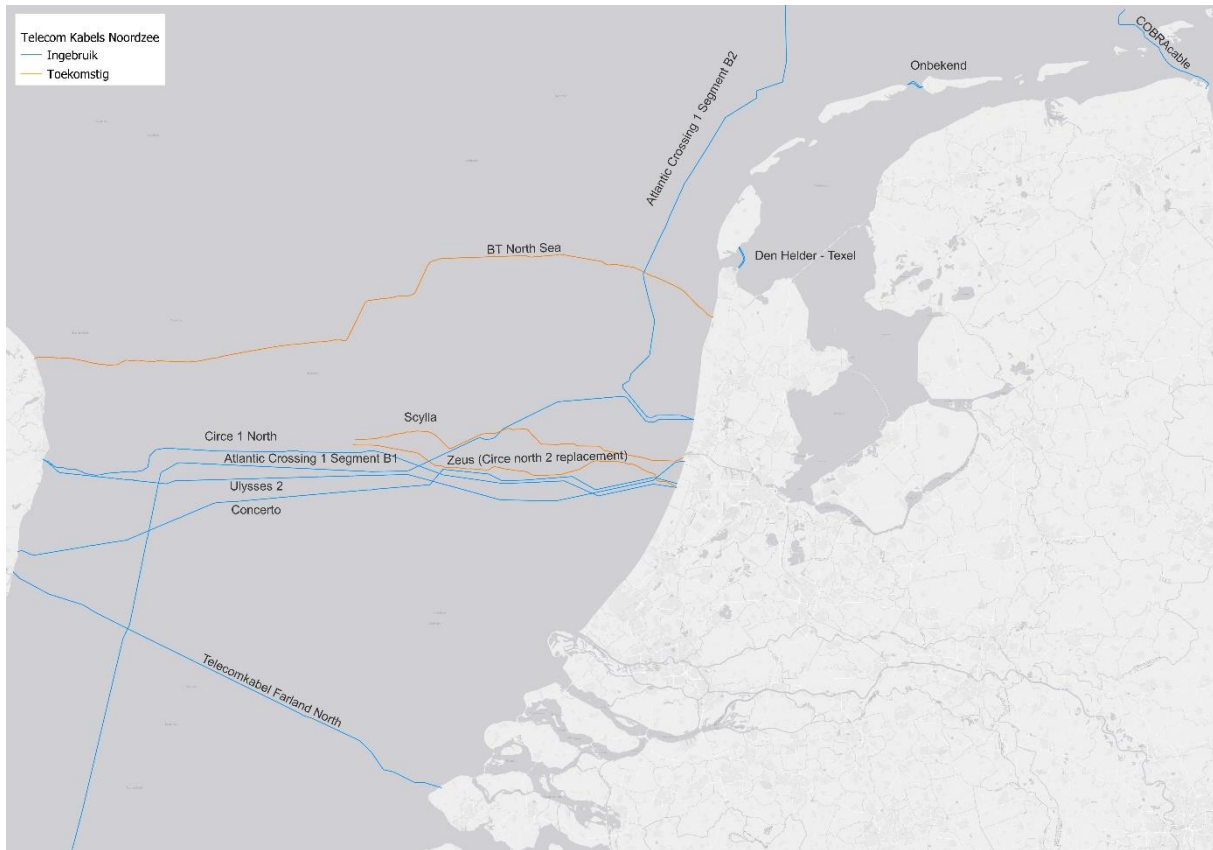
Figuur 1: Telecomzeekabels in blauw zijn bestaande en in geel geplande (voor zover tracé bekend)

De Ulysses 2 kabel is de oudste nog actieve kabel tussen het Verenigd Koninkrijk en Nederland. Atlantic Crossing 1 is de enige kabel die nog deel uit maakt van een trans-Atlantisch systeem. Het is een zogenaamde festoenkabel, waarbij het verkeer in een ring tussen de VS en een aantal Europese landen wordt geleid. Het deel dat in Nederland aanlandt is verbonden met Denemarken en het Verenigd Koninkrijk. Het is daarmee niet rechtstreeks gekoppeld aan de Verenigde Staten. Dat betekent dat Nederland geen rechtstreekse verbinding heeft met de Verenigde Staten. Hierbij moet wel worden opgemerkt dat dit ook gold voor de TAT-14 en Tyco kabels die beide in het VK aanlandden en dan doorgingen naar de Verenigde Staten. Voor zover bekend is er sinds de jaren '90 geen rechtstreekse verbinding vanuit Nederland naar de Verenigde Staten geweest. De Atlantic Crossing kabel is gebouwd met 2 vezelparen, waarop per vezelpaar 8 golflengtes verzonden werden, voor een initiële capaciteit van 20Gbps/vezelpaar. Upgrades maakten een capaciteit van 1Tbps in 2010 over de twee vezelparen mogelijk. 9